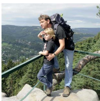
PUTOVÁNÍ A TURISTIKA