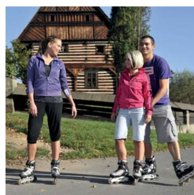
SPORT A RELAXACE