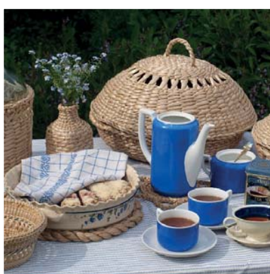
UBYTOVÁNÍ A SLUŽBY