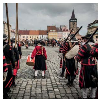
ZÁŽITKY A ZÁBAVA