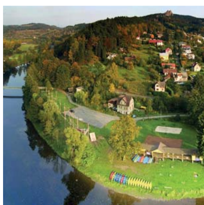
REGION ČESKÝ RÁJ