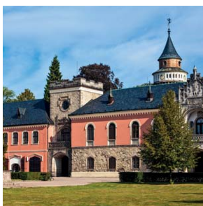
PAMÁTKY A ZAJÍMAVOSTI